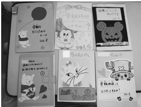
図1. 学生が作成した学習教材