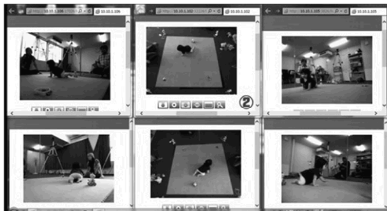
図3 ハイハイ動作の画像例