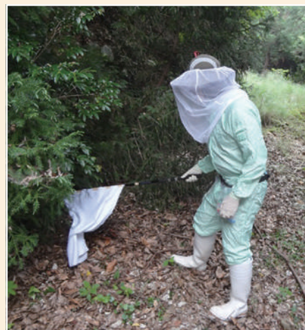
対馬でのマダニ採集のようす。防護服はアブにさされないようにするためです(注:本人ではありません)。