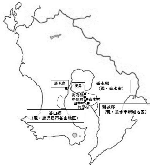
【図1】県集談会会員の所在地 12

安田為僖は明治15年11月3日付で政府に対し、「製糖資金拝借ノ義ニ付歎願書」を提出する。これによれば、西南戦争によって困窮する士族が増え、状況が厳しい中、垂水郷で