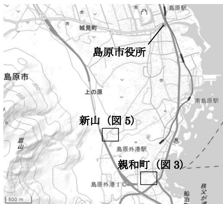
図1 親和町・新山両住宅地の位置

一方の新山は1946年夏から建設が始められたものの 6) 、1946年12月の住宅営団閉鎖によって建設途上で放置され、一部の入居にとどまったことから批判が巻き起こることになる。1947年12月以降にようやく入居が再開され、親和町とともに住宅が分譲されるに至った 7) 。なお、この新山に建設された住宅は51棟102戸だが、当時の新聞記事ではダブルカウントして伝えるものが多く、また島原の郷土史『島原の歴史』 8) でも(住宅営団とは示さずに)202戸