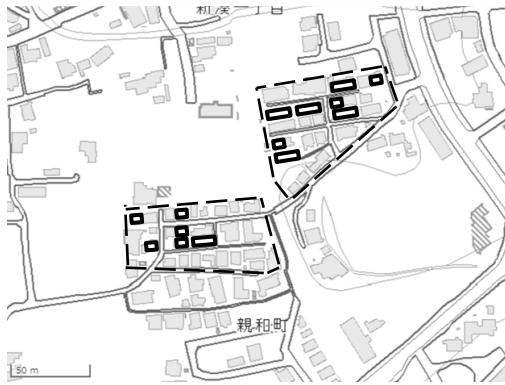
図3 親和町住宅地の範囲と当初の住宅の残存 完存6棟，半存8棟。2015年調査。