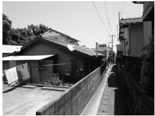
図4 親和町住宅地の現状 中央が当初の住宅の一つ。2015年撮影。