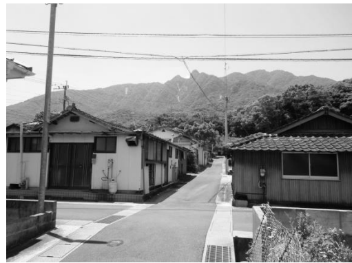
図6 新山住宅地の現状 左右とも当初の住宅。2015年撮影。